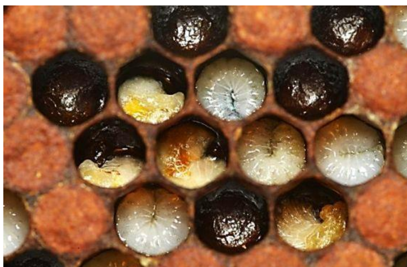
شکل شماره ۴- لاروهای مبتلا به لوک اروپایی. لاروهای آلوده ابتدا رنگ سفید خود را از دست داده و مات شده، سپس زرد و در نهایت قهوه‌ای متمایل به زرد می‌شوند.