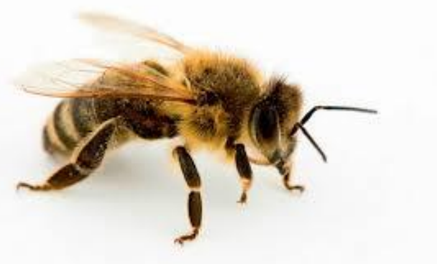
شکل شماره ۱- زنبور عسل

این مطالعه با استفاده از بررسی منابع معتبر موجود در زمینه شناسایی و درمان آفات زنبور عسل انجام شده است.