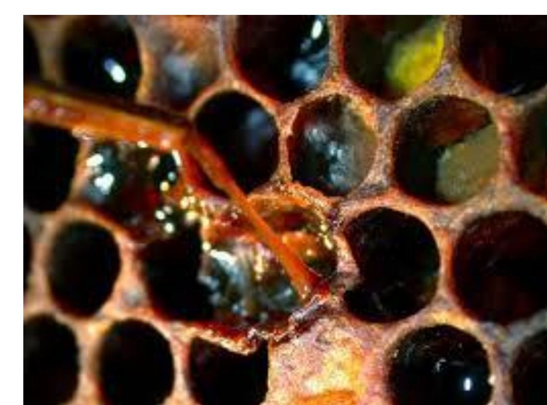
شکل شماره ۳- جسد لارو زنبور عسل مبتلا به لوک آمریکایی