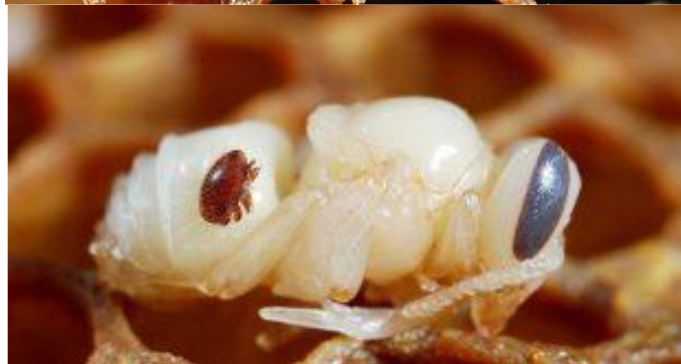
شکل شماره ۵- کنه‌های واروا روی لارو زنبور عسل