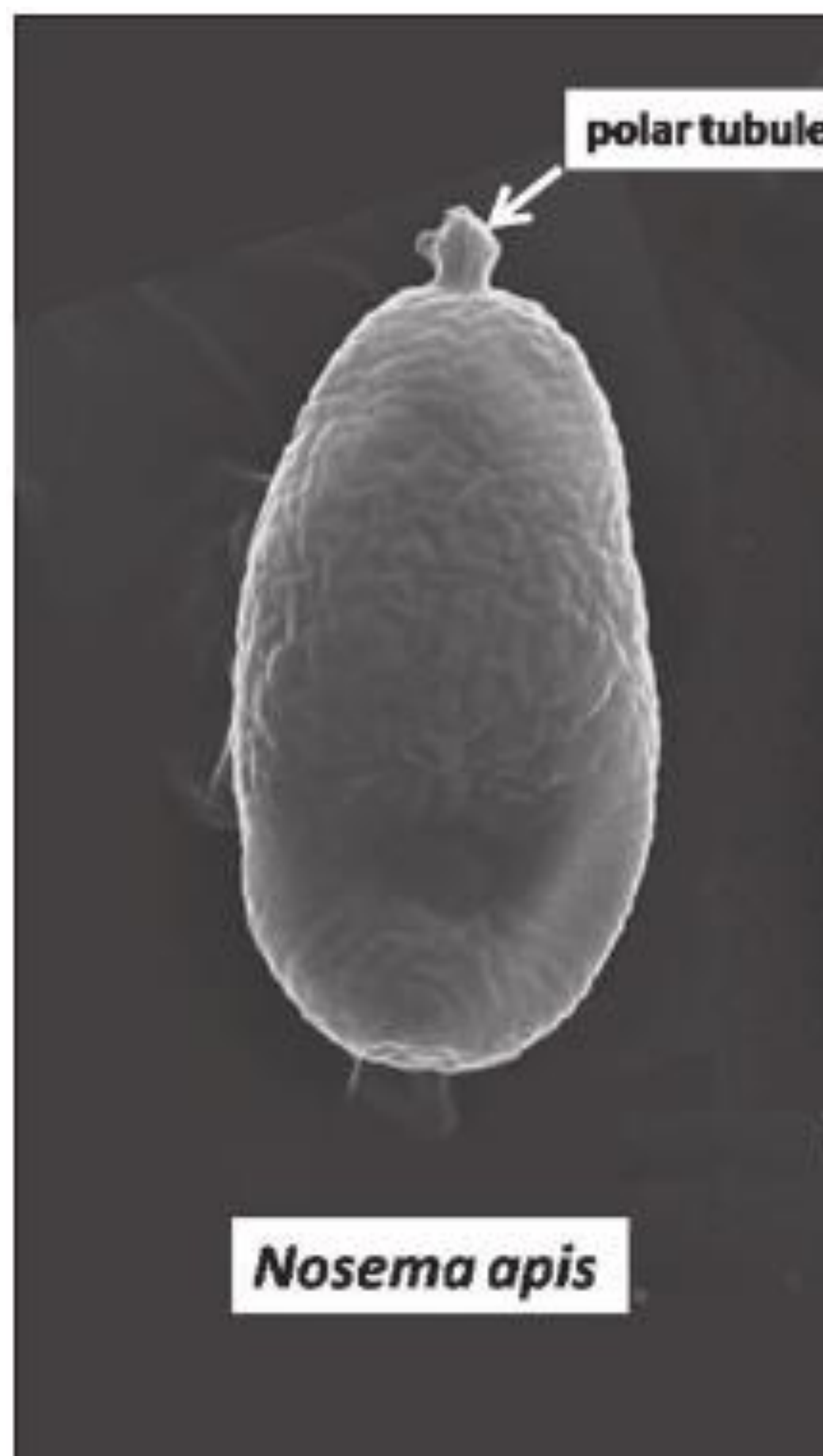
شکل شماره ۶- میکروگراف الکترونی از Nosema apis عامل بیماری نوزما در زنبور عسل